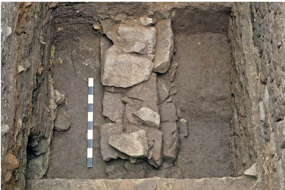
Figure 434 - Place Formigé, secteur oriental. Phase 1

Sondage k , mur 4 en blocs mal équarris liés à l'argile et ressaut de fondation.