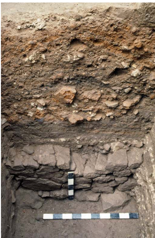
Figure 436 - Place Formigé, secteur oriental

Sondage M . Coupe stratigraphique de la berme ouest et vestiges du mur 4 (phase 1). Vue prise vers l'ouest.