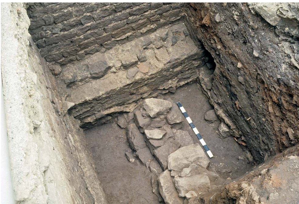
Figure 435 - Place Formigé, secteur oriental

Sondage K . Au fond, le mur 4 (phase 1) ; en arrière, le mur 25 (phase 2) jouxté par le mur 53 (phase 3) ; à g., mur 52 (phase 3) reposant sur le mur 27 (phase 2). Vue prise vers le sud-ouest (cliché L. Rivet).