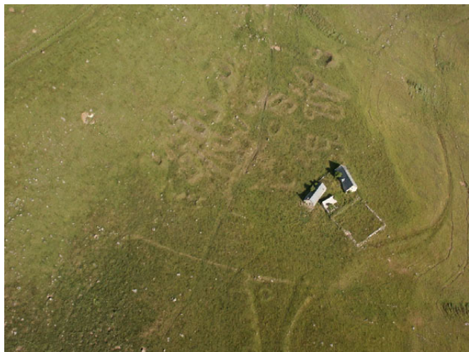
Fig. 3. Vue aérienne du site d'habitat de Troucouen Cézallier (Vèze, 15).

été tentés de conclure que ces périodes étaient absentes de cette région.