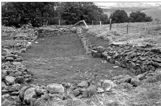
Fig. 2. Fouille extensive d'un habitat agro-pastoral : plan de la maison mixte de Cantegal (Condom-d'Aubrac, 12).

les pâturages dès le Moyen Âge et pouvaient correspondre aux unités agro-pastorales des mas ; les données archéologiques proposaient des datations s'échelonnant du XI e au XIII e s., enfin la présence de tourbières permettait d'étudier l'environnement paysager des sites.