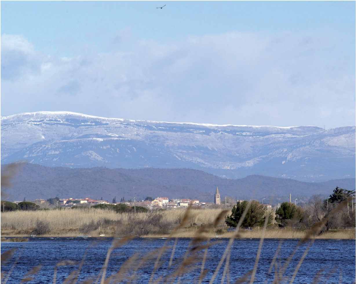
Vue de Fréjus depuis les étangs de Villepey avec, en arrière plan, les sommets enneigés du plateau de Canjuers.