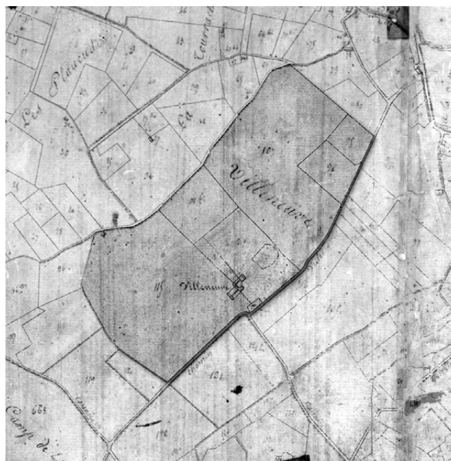
Fig. 233. Détail du cadastre napoléonien de 1826.

Le mobilier subactuel est rare. On compte quatre bords d'objets en porcelaine mécanique renvoyant au plus tôt au XIX e siècle ou au début du XX e siècle. De façon anecdotique, on soulignera encore la présence de deux témoins d'une fréquentation du site au Moyen Âge. Il s'agit d'un bord de marmite à pâte grise grésée et d'un bord de marmite à glaçure interne jaune de l'Uzège (fig. 234 - n o 18). Ce dernier est daté des XIV e et XV e siècles (Amouric et al. 1995, fig. 102-103, 107).