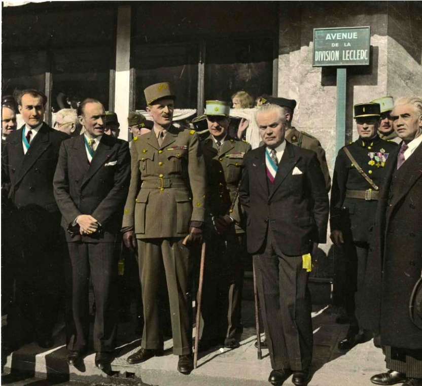
Arch. com. Antony, 12 Z 9