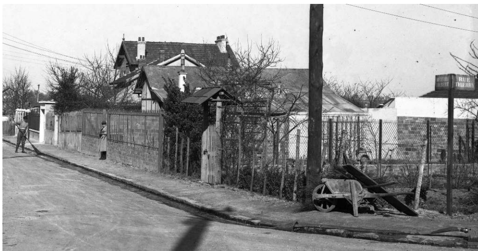
Fig. 2 : Boulevard Colbert à l'angle de la rue Thierry, v. 1935

Arch. com. Antony, Fi, photographie sur plaque de verre