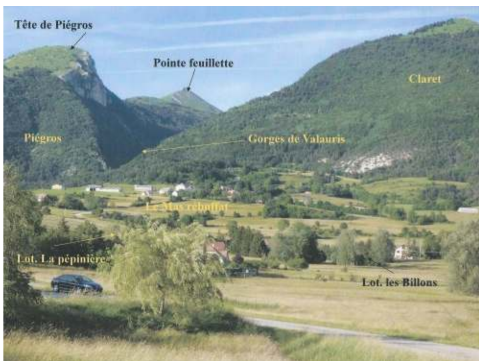
Fig. 9 : Tête de Piégros