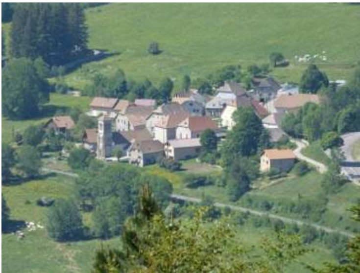
Fig. 1 : Le Village (anciennement L'Église )