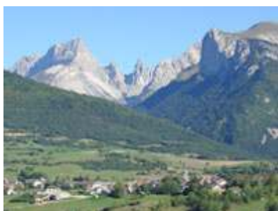
Fig. 3 : Les Lussettes