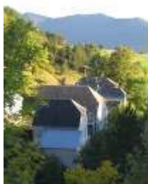
Fig. 2 : Les Amayères