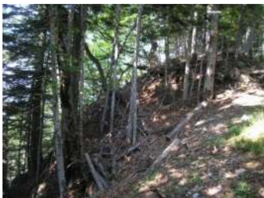
Fig. 8 : Col du Pendu