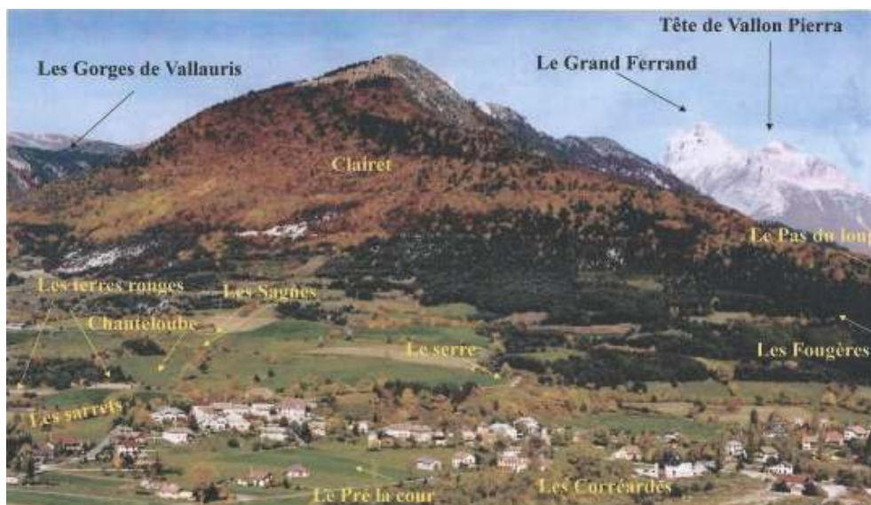
Fig. 16 : Le Pas du Loup