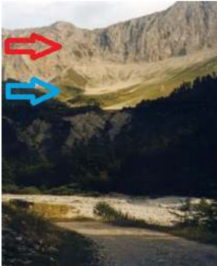
Fig. 14 : Le Collet de Mougious (flèche rouge) ; Le Pòu (pâturage) (flèche bleue)

appelée Le Pòu (origine inconnue) par nos informateurs. Et la localisation de ce pâturage est assurée par la référence à une petite hauteur située un peu en-dessous de la crête des aiguilles de Lus : le Collet de Mougious .