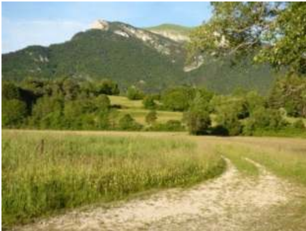
Fig. 10 : Le Chamouset vu des Treches