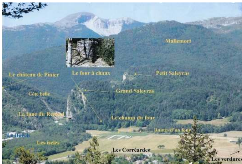
Fig. 12 : Le Champ du Four