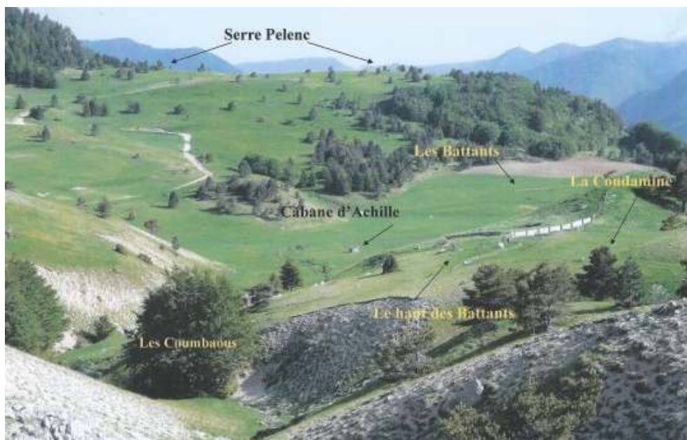
Fig. 13 : La Condamine des Sièzes