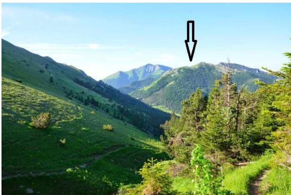
Fig. 11 : Serre-les-Têtes

substantif montagne est très souvent utilisé pour désigner un pâturage 7 . Le même informateur affirme qu'autrefois la crête qui est connue aujourd'hui sous le nom de Serre-les-Têtes – un serre, ou hauteur allongée, qui a effectivement deux têtes – était appelée autrefois, dans le parler local, Les Sesté . Il s'agit vraisemblablement d'un dérivé du latin cesta "panier", employé métaphoriquement 8 . Si l'on regarde bien la photo, on conviendra aisément que les deux dénominations, tête et petit panier, correspondent à deux façons de voir le même site : si l'on est sensible aux creux, on parlera de paniers, si on préfère voir ce qui émerge, on se référera à la tête.