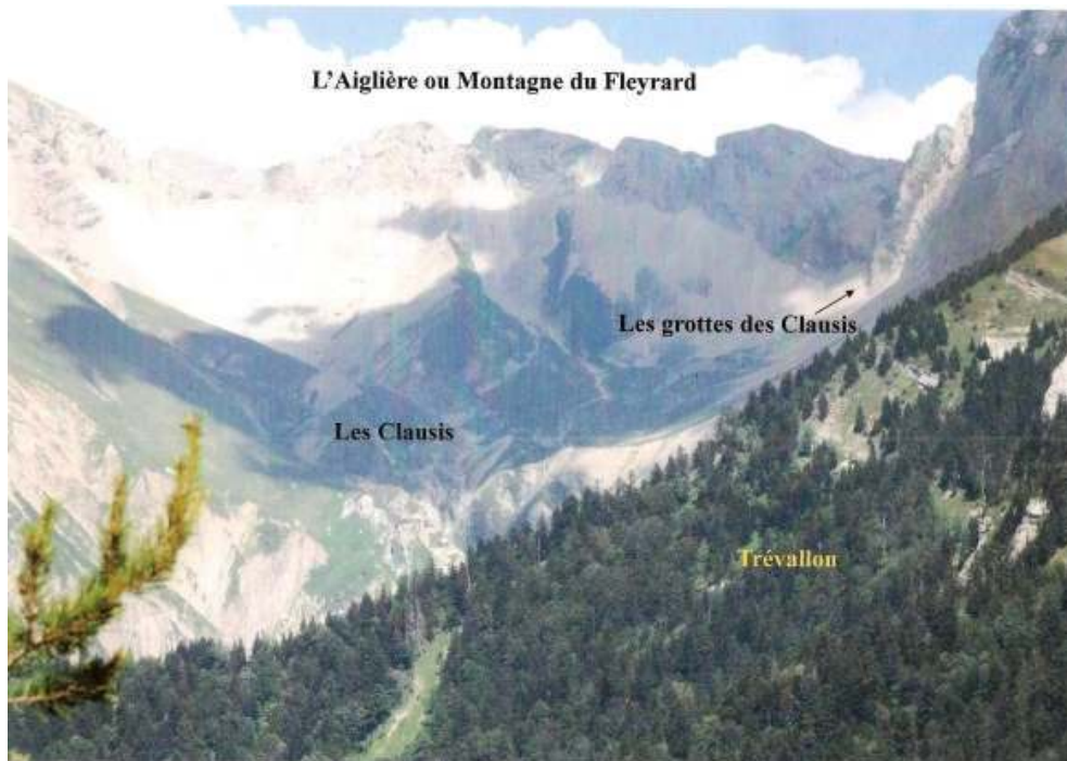
Fig. 6 : L'Aiglière ou Montagne du Fleyrard