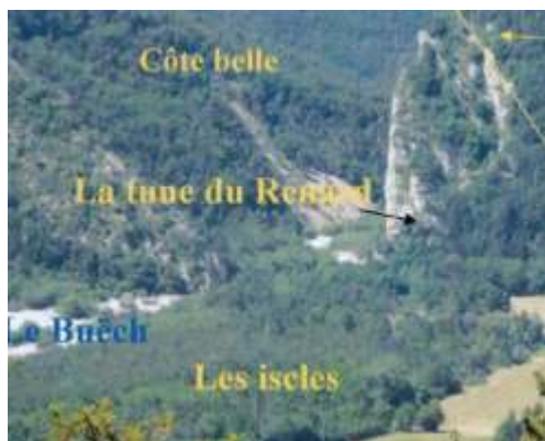
Fig. 15 : La Tune du Renard

inventaire des toponymes tels que Pas de Saint Pierre , Pierre de l'Ours , Pierre de l'Ogre , Tune du Renard , Pas du Loup , Chanteloube .