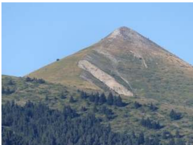
Fig. 7 : Pointe Feuillette