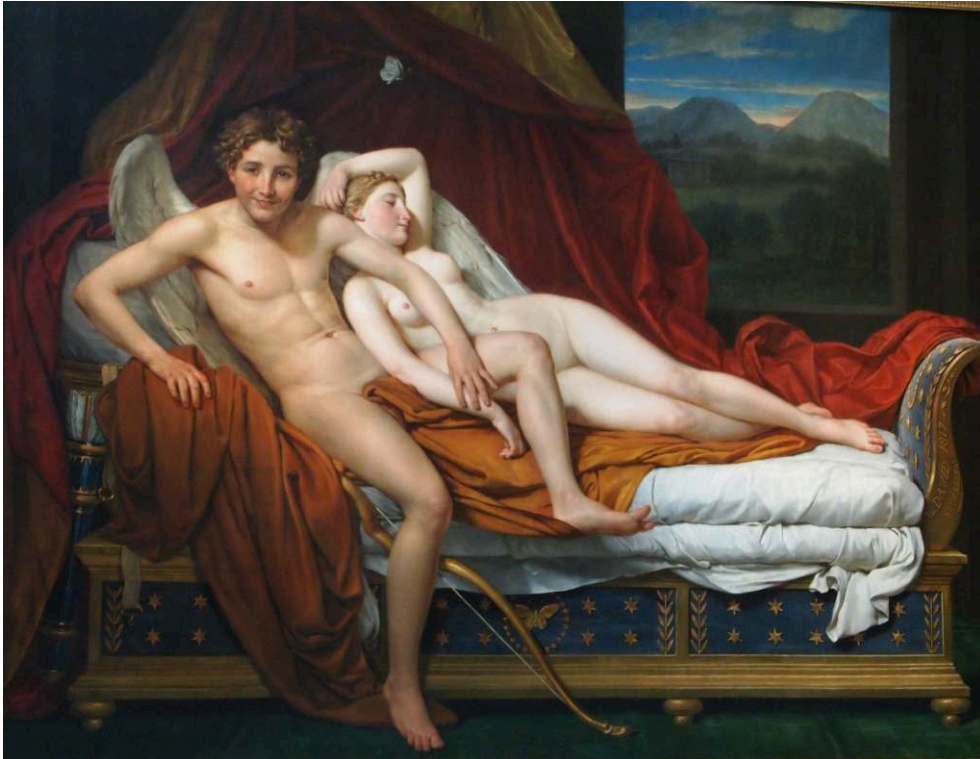
1817, huile sur toile, 184 x 241 cm, Cleveland, The Cleveland Museum of Art.