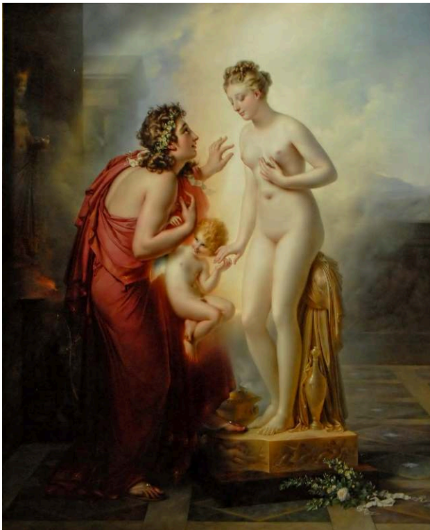
Salon de 1819, huile sur toile, 253 x 202 cm, Paris, musée du Louvre.

1. Anne-Louis Girodet, Pygmalion et Galatée