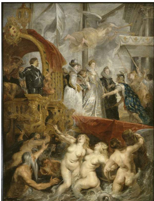
1622-1625, huile sur toile, 394 x 295 cm, Paris, musée du Louvre.