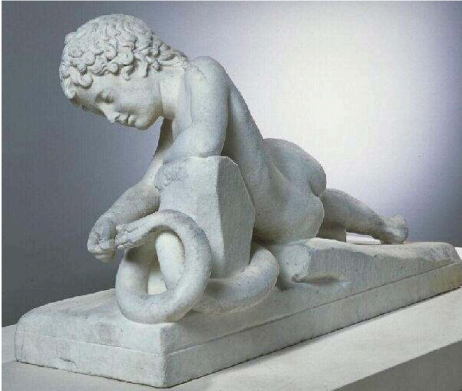
1822, marbre, 57 x 95 x 35 cm, Douai, hôtel de la sous-préfecture.