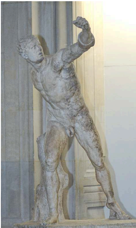
IIIe-1er siècle avant J.C., sculpture, marbre, 199 cm, Paris, musée du Louvre.