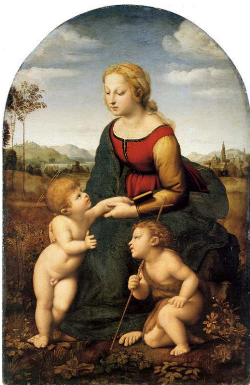
1507-1508, huile sur toile, 122 x 80 cm, Paris, musée du Louvre.