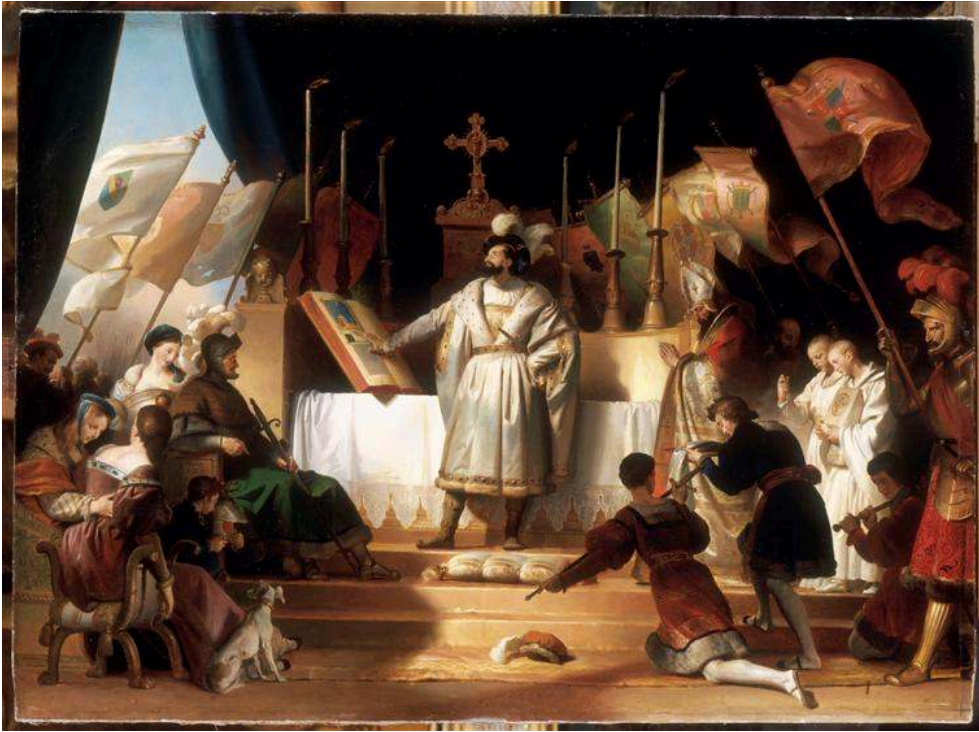
Salon de 1819, huile sur toile, 85,5 x 115,5 cm, Paris, musée du Louvre.