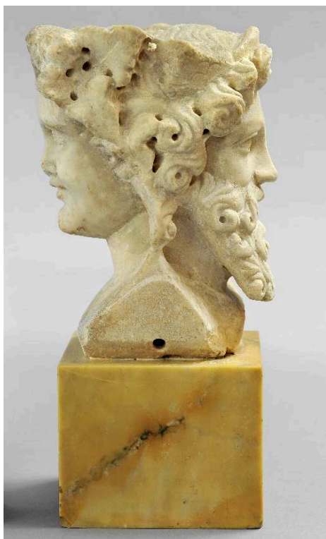
Marbre, H. 24,5 cm, II e siècle ; Cabinet des médailles, Inv. 57.41.