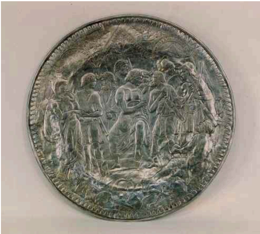
Argent, diam. 71 cm ; Cabinet des médailles.