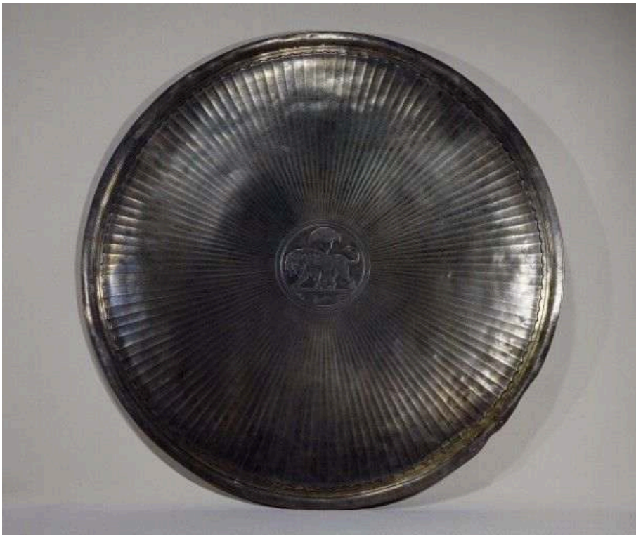
Argent, diam. 73 cm ; Cabinet des médailles.