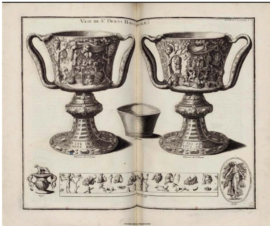
1. Pl. CLXVII : coupe des Ptolémées, du Trésor de Saint-Denis Bernard de Montfaucon Publiée dans Antiquité expliquée , t. I, 2 e partie, 1719.