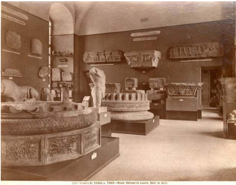
(L.G. Lévy) N° 22504.s. PARIS — Musée National du Louvre, Salle de Milet.

2. Vue de la salle de Milet à la fin du XIX e siècle, Paris, musée du Louvre, documentation du département des Antiquités grecques, étrusques et romaines.