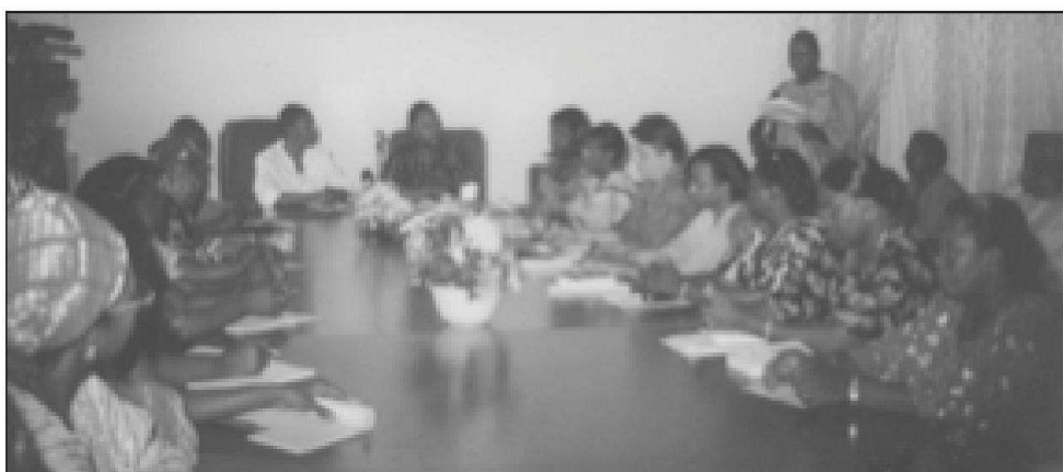
IMMORTALISATION D'UN TRAVAIL : PRÉSENTATION DE LA BROCHURE NATIONALE SOUS LA PRÉSIDENCE DE LA MINISTRE DE LA PROMOTION DE LA FEMME ASSISTÉE DE SON HOMOLOGUE DES DROITS HUMAINS