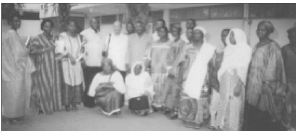
EQUIPE ET MEMBRES DE LA CAVAD QUI NE TARDERONT PAS À SE SUBDIVISER EN DEUX GIE