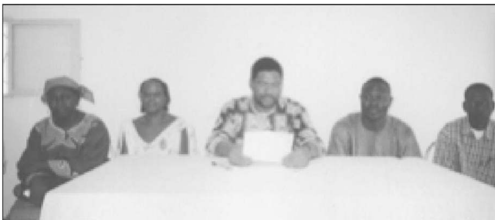
CLÔTURE DE LA SESSION DE FORMATION DE KOUDOUGOU PAR LE SECRÉTAIRE GÉNÉRAL DE LA PROVINCE DU BULKIEMDÉ