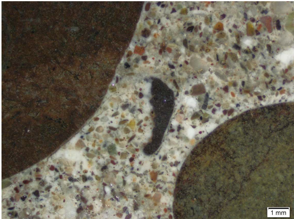
Figure 3 : faciès du mortier M1 à la loupe binoculaire (x6.7) sur section polie

On note l'abondance des agrégats (sable silicaté fin à grossier) jointifs, de taille moyenne 0,5 mm environ, ainsi que la présence de quelques grains de tuileau orangé et de petits grumeaux de chaux blanchâtre. La matrice carbonatée est blanchâtre.