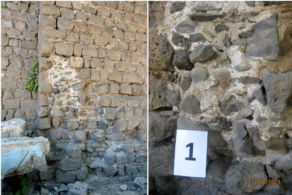
Figure 2 : prélèvement du mortier M1 sur un angle de la Tour 15 (face nord du rempart de la citadelle), aspect du mortier et de la maçonnerie de blocage (fragments de basalte)