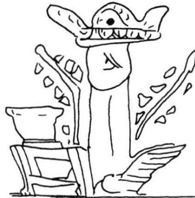
4. Skyphos attique à figures rouges Munich 8934