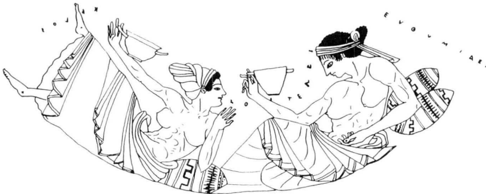
2. Hydrie attique à figures rouges Munich 2421 (ARV 2 , 23, 7)