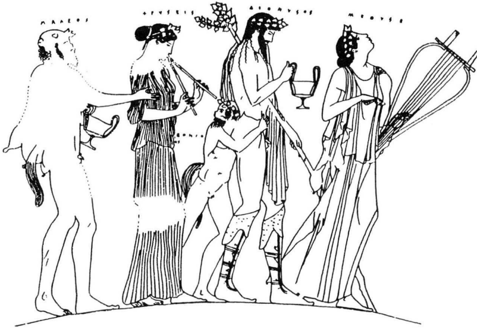
5. Cratère New York 07.286.85 (ARV 2 632, 3)