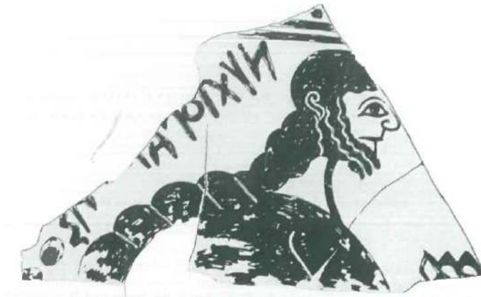
Fig. 2. - Fragment de cratère protoattique, élève du Peintre de l'Amphore du Cinosarges, vers 670-660 av. J.-C. Trouvé dans l'Agora d'Athènes. Athènes, musée de l'Agora, inv. p. 13323.