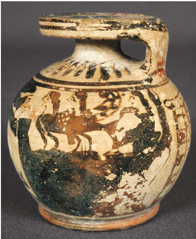
Fig. 1. - a : Aryballe globulaire corinthien. Corinthien Moyen, vers 600-580 av. J.-C. H. 10,2 cm, Diam. 9,5 cm. Boston, Museum of Fine Arts, inv. 01.8100.

suivant une hypothèse généralement non retenue de John Pollard, il serait possible d'y voir la magicienne Circé, dont la présence serait corroborée, à droite de la composition, par la représentation schématique de son palais 4 . Ainsi, le peintre exerce son talent de narrateur en recréant, peut-être à partir de deux épisodes différents de l' Odyssée , mais qui se suivent, une même scène, où lors de l'épisode du passage du rocher des Sirènes, l'épisode de Circé et de l'aide qu'elle apporte à Ulysse est mis en abyme : chez Homère, c'est Circé qui parle des Sirènes à Ulysse, et qui l'aide à échapper au sort terrible qui lui était destiné, en montant le stratagème bien connu qui consiste à boucher les oreilles de ses compagnons avec de la cire et à se faire attacher au mât du bateau.