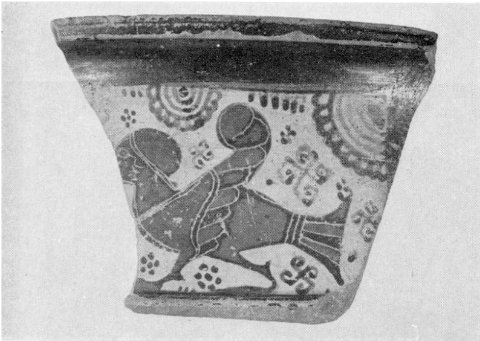
Fig. 8. - Fragment de col de dinos, production d'Ionie du Nord (Smyrne ?), vers 600 av. J.-C. Du temple d'Athéna à Bayraklı.