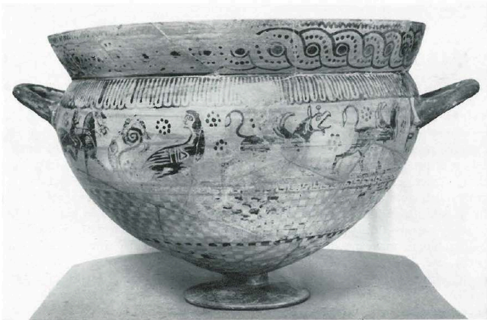
Fig. 7. - Kylix du Peintre des Hirondelles (Production de la cité de Vulci), vers 630-600 av. J.- C. De Vulci. Rome, Villa Giulia, inv. 65455.