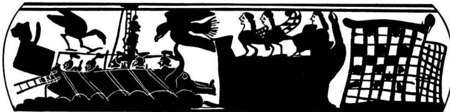
Fig. 1. - b : L'épisode du passage du navire d'Ulysse près du rocher des Sirènes.