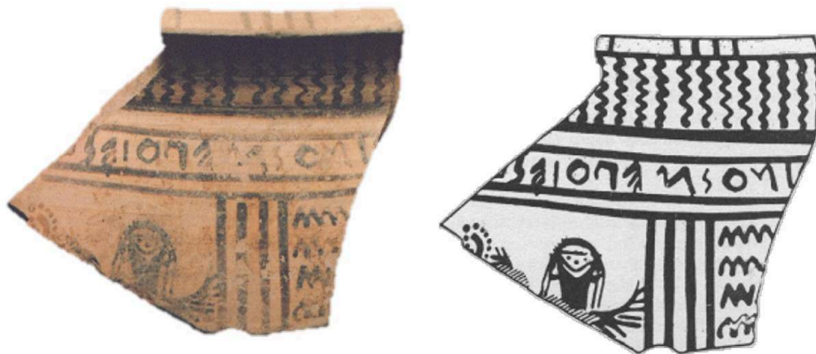
Fig. 4. - Fragment de cratère tarso-géométrique, dernier tiers VIII e siècle av. J.-C. De Pithécusses (Ischia), localité Mazzola (Lacco Ameno).