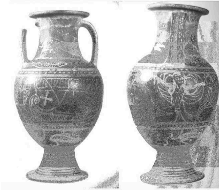
Fig. 6. - Amphore en white-on-red du Peintre de la Sirène ourartéenne (Production de la cité de Cerveteri), vers 630 av. J.-C. De Cerveteri, nécropole de la Banditaccia, tombe 17. Ht. 56 cm Ø col 15,5. Milan, Civiche raccolte Archeologiche, inv. A17786.