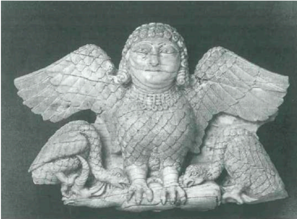
Fig. 3. - Élément de mobilier en ivoire. Production nord-syrienne, fin VIII e siècle av. J.-C. De Nimrud, Palais Nord-Ouest. Bagdad, Iraq Museum, inv. 79225-7ND.21.