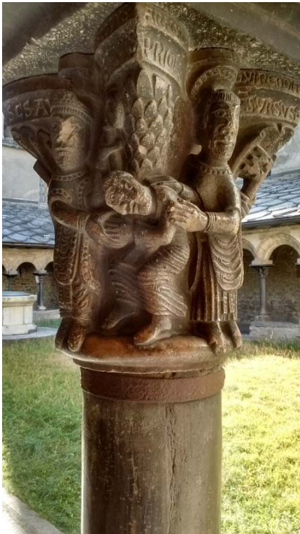
Fig. 2. – Chapiteau n° 35, côté sud-est, du cloître de Saint-Ours : le prieur Arnulphe est au centre ; saint Augustin à gauche ; saint Ours à droite.