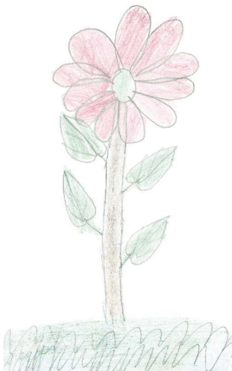
DIBUJO DE LOS NIÑOS DEL PUEBLO DE SAN FRANCISCO CHONTLA.