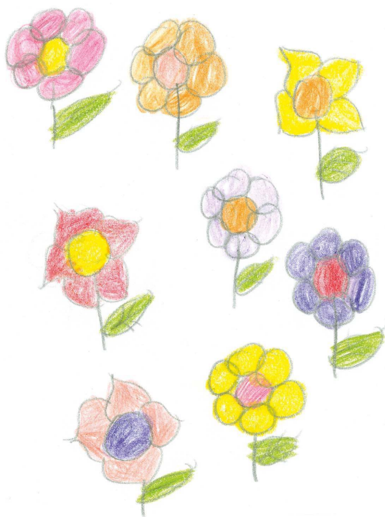
DIBUJO DE LOS NIÑOS DEL PUEBLO DE SAN FRANCISCO CHONTLA.