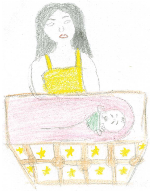
DIBUJO DE LOS NIÑOS DEL PUEBLO DE SAN FRANCISCO CHONTLA.