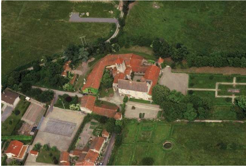
Fig. 412 - Vue aérienne du site dans les années 1990.