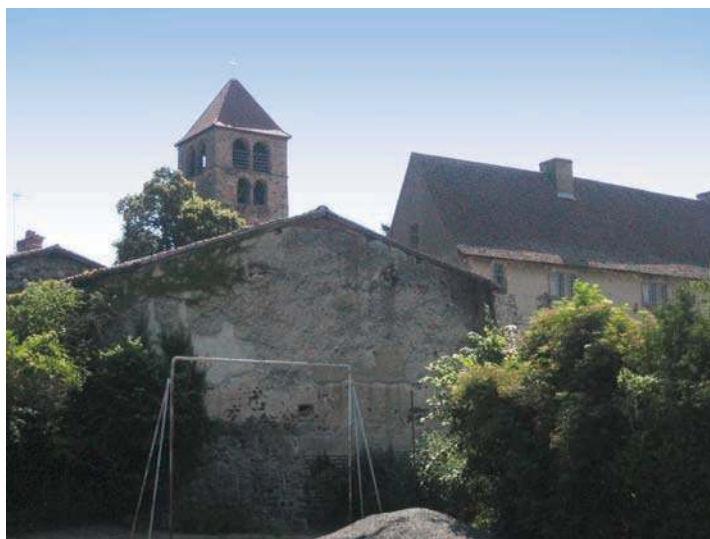
Fig. 416 - Vue générale du clocher et du manoir.