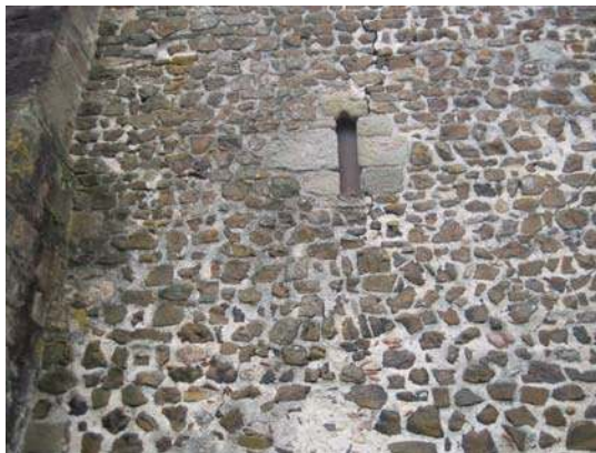
Fig. 414 – Détail d'une baie romane de l'église.