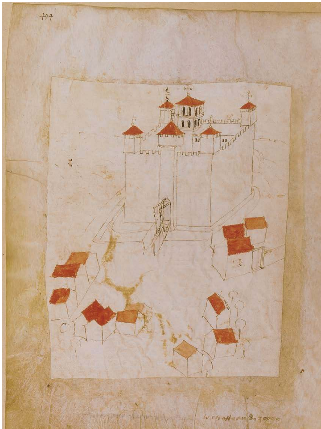
Fig. 411 - Vignette de l'Armorial de Guillaume Revel (Bnf, fr. 22297, p. 494) : le chasteau d'izoyre.