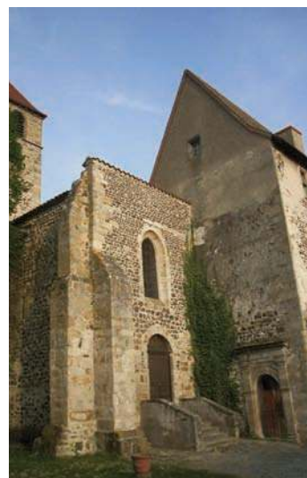
Fig. 417 - La façade occidentale de l'église et le mur pignon nord du manoir.