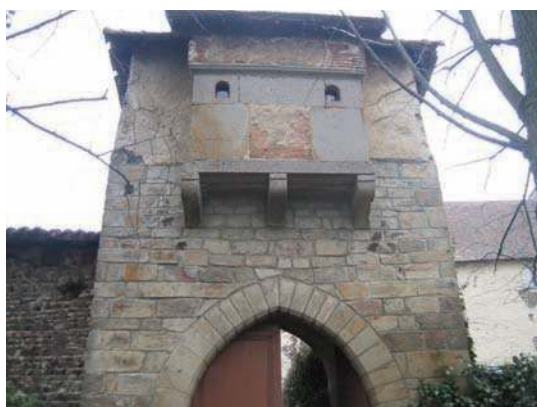
Fig. 418 - Vue extérieure de la porte actuelle du site.