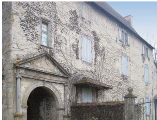
Fig. 415 – Façade sur cour du manoir actuel.