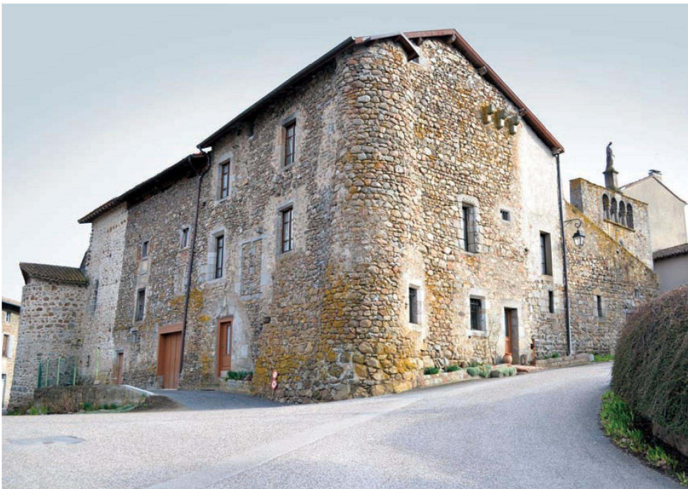
Fig. 396B – L'HÔPITAL-SOUS-ROCHEFORT : ANGLE NORD-OUEST DE L'ENCEINTE FORTIFIÉE DU PRIEURÉ.