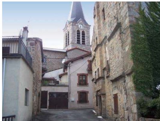
Fig. 394 – Emplacement de la porte orientale du rempart.

transformé en jardins, son tracé est encore très nettement visible. L'église actuelle a été entièrement reconstruite. Septentrionnée, elle s'étend au-delà du rempart médiéval, l'abside empiétant sur le fossé nord qui a été remblayé. L'ancienne église, orientée, était précédée d'un clocher-porche, comptant trois travées seulement, scandées par deux contreforts au nord, et un collatéral au sud. L'abside semi-circulaire, déportée au sud, ouvrait peut-être sur le cimetière ou un espace prioral.