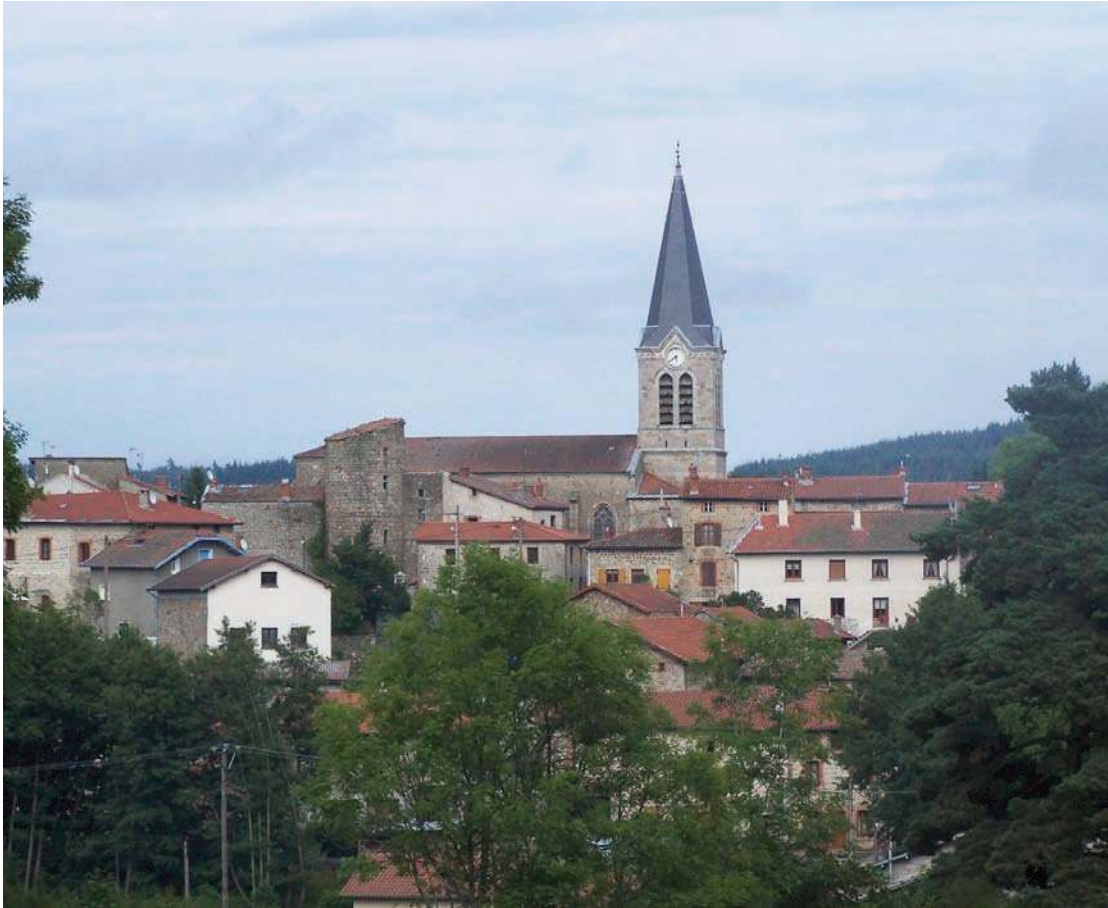
Fig. 391 – Vue d'ensemble du site depuis l'ouest.