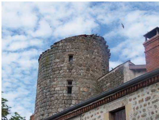
Fig. 393 – Détails du sommet de la tour de flanquement nord-ouest, avec vestiges de mâchicoulis.