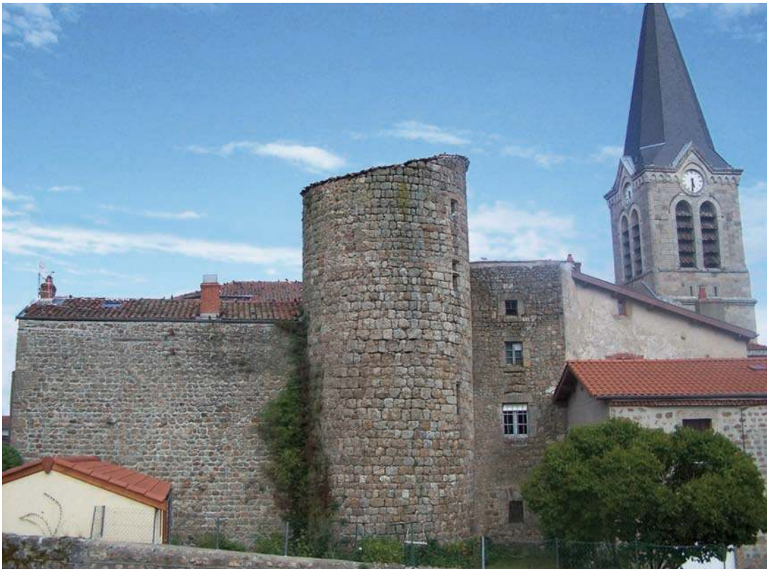
Fig. 392 – Tour de flanquement de l'enceinte au nord-ouest. À l'arrière-plan, le clocher de l'église actuelle.