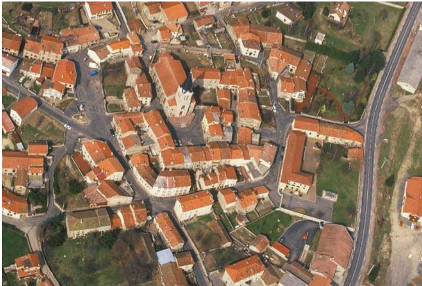
Fig. 389 - Vue aérienne du site dans les années 1990.