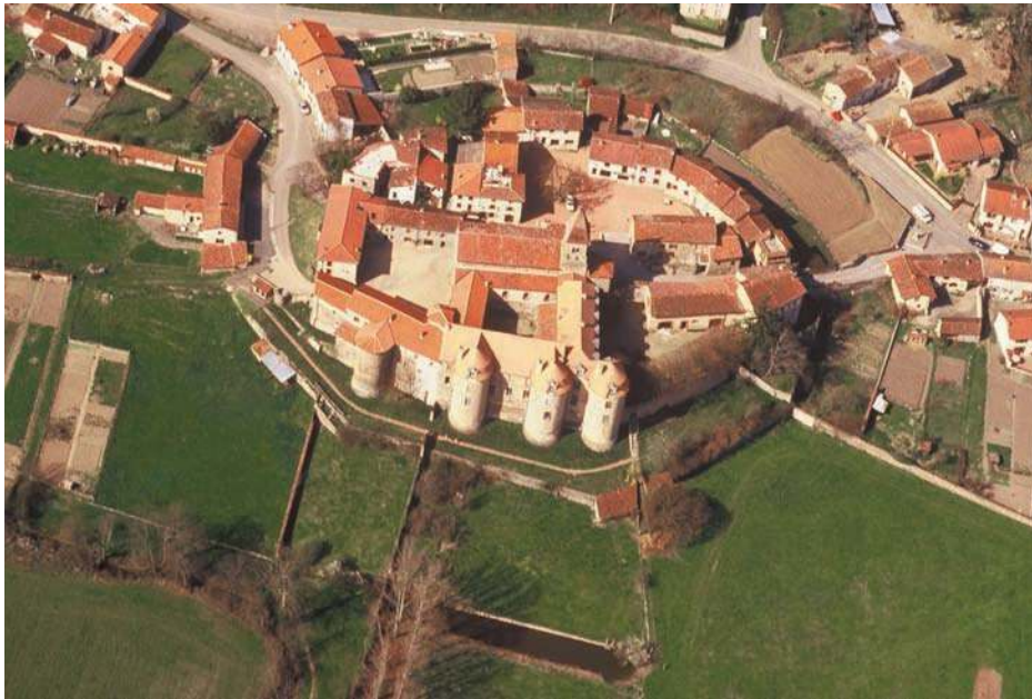
Fig. 374 - Vue aérienne du site dans les années 1990.