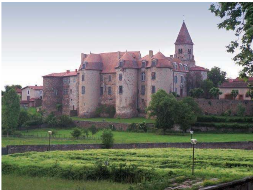
Fig. 376 - Vue générale du site vers le nord.