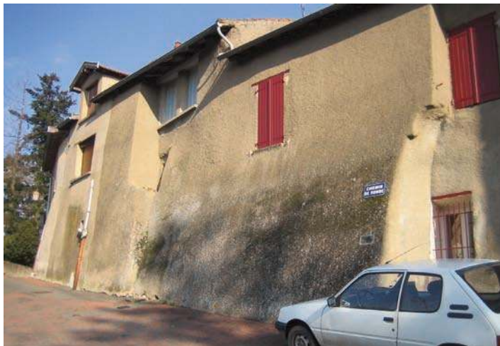
Fig. 315 - Vestiges des élévations du rempart, rue du Chemin de ronde.