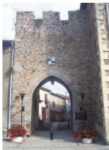
Fig. 318 - Porte nord-ouest (porte de Bise), vue extérieure.