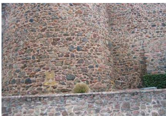
Fig. 319 - Détail d'une canonnière bouchée sur la tour de flanquement circulaire.