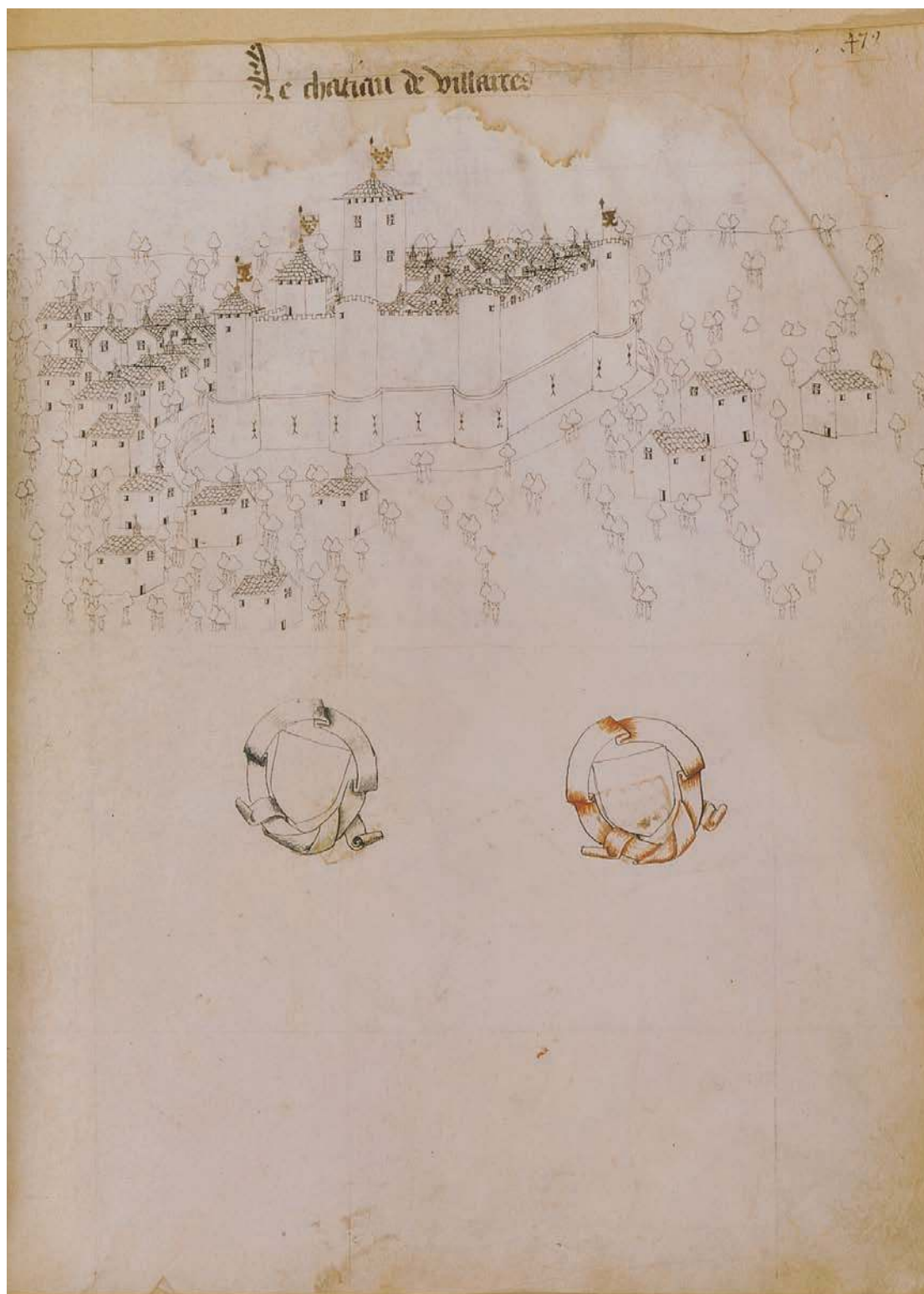
Fig. 312 - Vignette de l'Armorial de Guillaume Revel (Bnf, fr. 22297, p. 479) : le chatiau de Villaires.