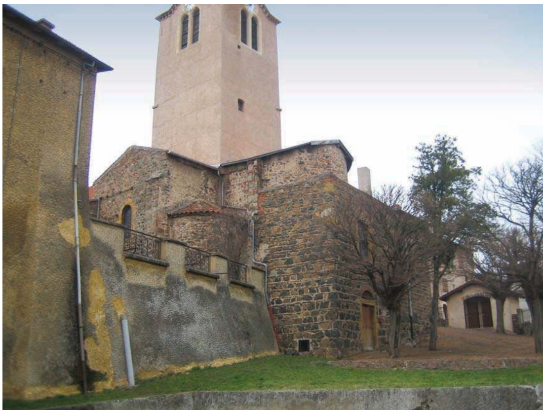
Fig. 321 - Le chevet de l'église Saint-Priest.

L'enceinte de la ville close est encore tout à fait perceptible dans le parcellaire. Toutefois, à la différence de la représentation de l'Armorial, qui la figure quadrangulaire, celle-ci apparaît circulaire ou tout au moins sub-circulaire. De cette enceinte, outre son emprise dans le maillage parcellaire, subsistent quelques belles élévations (qui montrent plusieurs campagnes de construction) (fig. 315, 317, 320) ainsi que des vestiges (très restaurés) de la « porte de Bise » (fig. 318) – invisible sur l'Armorial car dissimulée aux yeux du dessinateur par la courtine orientale – et d'au moins trois tours de flanquement (une circulaire et deux quadrangulaires) (fig. 316, 317, 319). Sur le plan cadastral du XIX e siècle, le sud du bourg enclos se partage globalement en deux pôles qui se font face de part et d'autre de la rue de Bise et témoignent des deux pouvoirs qui se partageaient autrefois le lieu : au sud-est, le pôle religieux autour de l'église (fig. 321) et d'un logis prioral encore partiellement médiévaux et, au sud-ouest, le pôle laïc où le château médiéval se manifeste encore par quelques éléments architecturaux qui mériteraient une étude plus fine.