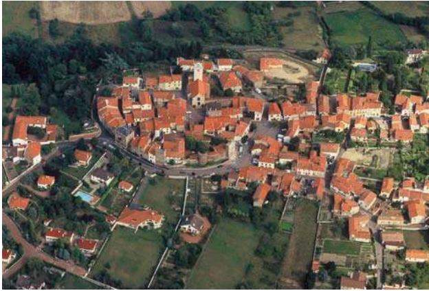
Fig. 313 – Vue aérienne du site dans les années 1990.