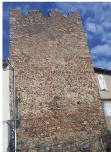
Fig. 316 - Tour rectangulaire crénelée, à l'ouest de l'enceinte.