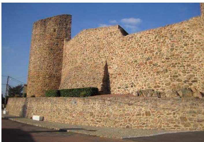
Fig. 317 - Tour de flanquement circulaire sur l'enceinte à l'ouest.