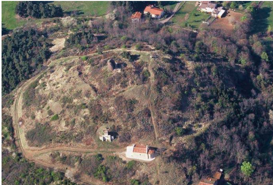
Fig. 231 - Vue aérienne du site dans les années 1990.