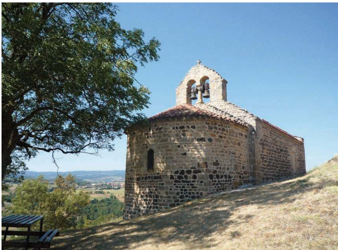
Fig. 237 - Le chevet de la chapelle Sainte-Marie.

qu'une ouverture, appareillée en brique, a été ménagée dans la façade occidentale, au-dessus de la porte. Rien ne subsiste plus de l'habitat civil médiéval représenté sur la vignette et mentionné dans les terriers. Déserté, il est totalement tombé en ruine et a disparu. Tout au plus, le parcellaire peut en conserver le souvenir. En effet, des parcelles de petite taille sont adossées au chemin qui ceinture le site. De plus, le terrain est à cet endroit perturbé par de nombreuses anomalies topographiques, bourrelets et creux, pouvant renvoyer aux substructions de bâtiments anciens, ce que viennent corroborer de nombreux éboulis peu naturels.