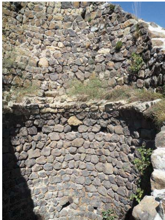
Fig. 236 - Vue intérieure de la tour maîtresse circulaire.