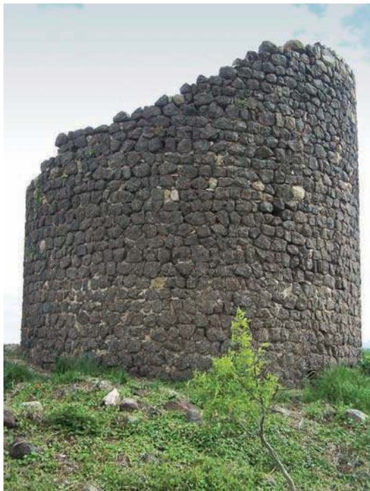
Fig. 235 - Détail des vestiges de la tour maîtresse circulaire.