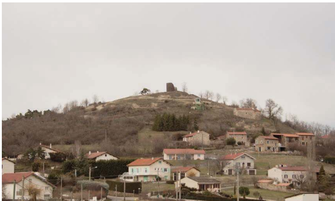
Fig. 233 - Vue d'ensemble du site.