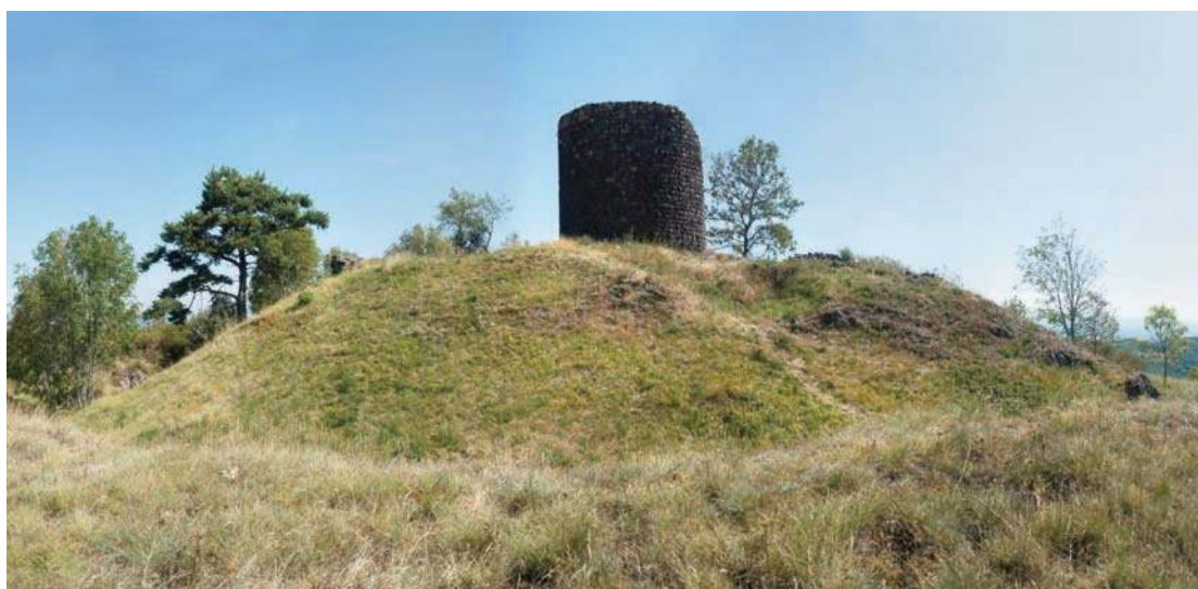
Fig. 234 - La tour maîtresse et son fossé, assemblage panoramique.