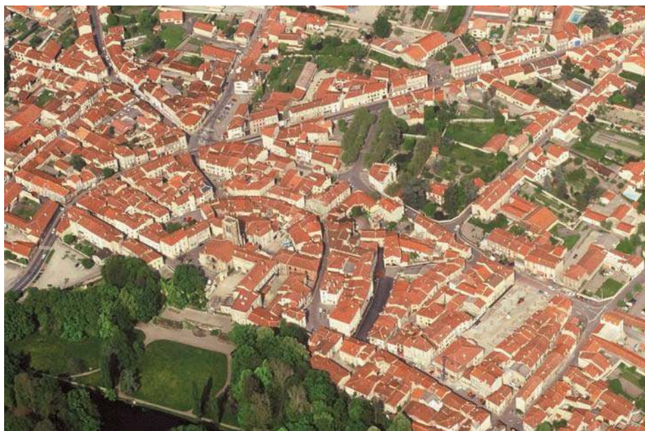
Fig. 208 - Vue aérienne du site dans les années 1990.