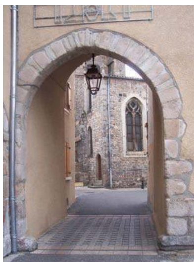
Fig. 212 - Vestiges de la porte de Putheo (dite aujourd'hui porte du Cloître) dans l'enceinte castrale primitive.