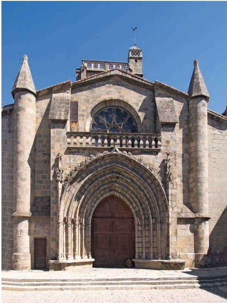
Fig. 214 - Façade ouest de l'église Saint-André près du château.