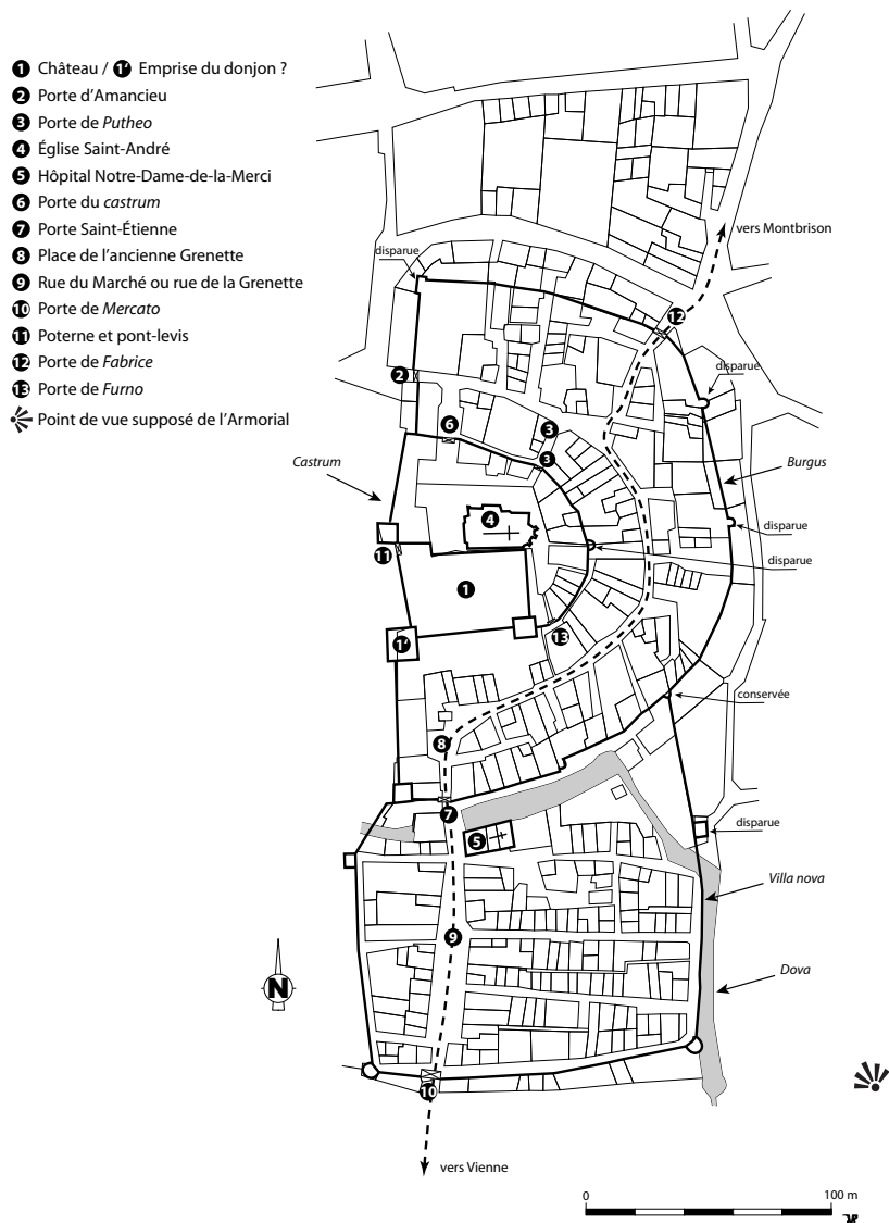
Fig. 209 - Hypothèse de restitution du site (reportée sur le plan cadastral du XIX e siècle) d'après le parcellaire, les vestiges archéologiques et les informations de l'Armorial de Guillaume Revel.