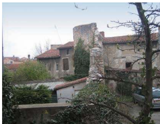
Fig. 211 - Une des rares tours de flanquement de l'enceinte de Sury encore en élévation.