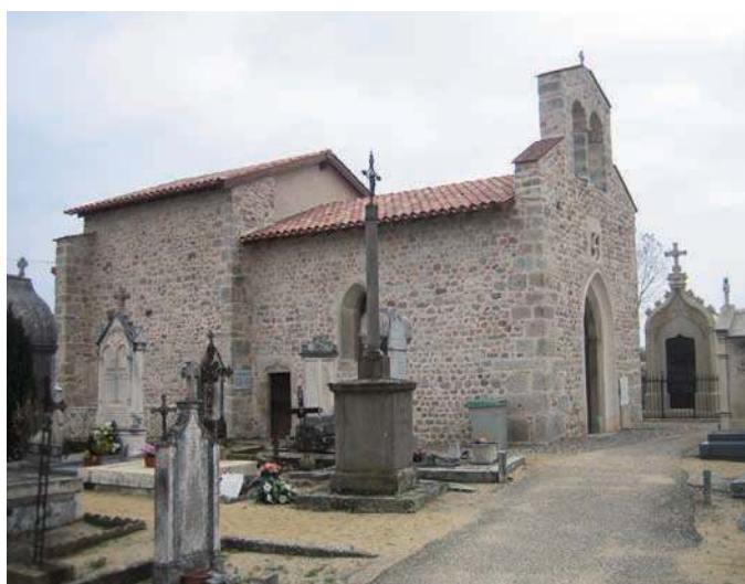
Fig. 213 - La chapelle Saint-Étienne dans le cimetière actuel de Saint-Héand, au sud du bourg.

d'ouvertures de tir à leur base. À ces cinq tours circulaires, il faut adjoindre trois, ou peut-être quatre, tours de plan carré. Elles possèdent toutes un hourd, des ouvertures de tir à leur base et sont sommées d'un étendard. De petites ouvertures sont, par ailleurs, visibles juste sous les hourds, à raison d'une par face. Deux imposantes tours-portes de plan carré complètent le système de défense. Elles sont situées aux angles nord-est et sur la face sud et sont toutes deux précédées d'un pont-levis et d'une barbacane plus ou moins complexe. Cette première enceinte est doublée d'un fossé en eau dont l'escarpe est nettement figurée sur le dessin 10 . La seconde enceinte est globalement quadrangulaire. De surface plus restreinte que la première, elle se développe au sud de celle-ci dont elle paraît toutefois séparée par le fossé en eau. Constituée de hauts murs crénelés, cette deuxième enceinte est cantonnée de sept tours semi-circulaires ou circulaires régulièrement réparties et un imposant châtelet d'entrée, pourvu de tours circulaires, perce le centre de son flanc sud. Le dessin ne montre pas clairement de douves pour cette enceinte, si ce n'est peut-être au sud.