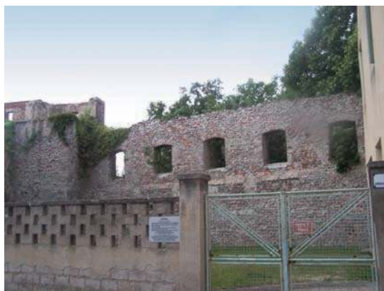
Fig. 210 - Vestiges du château d'époque moderne près de l'église Saint-André.