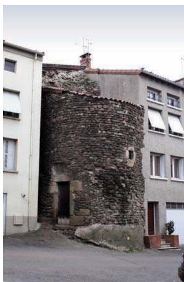
Fig. 187 - Vestiges d'une des tours de l'enceinte.