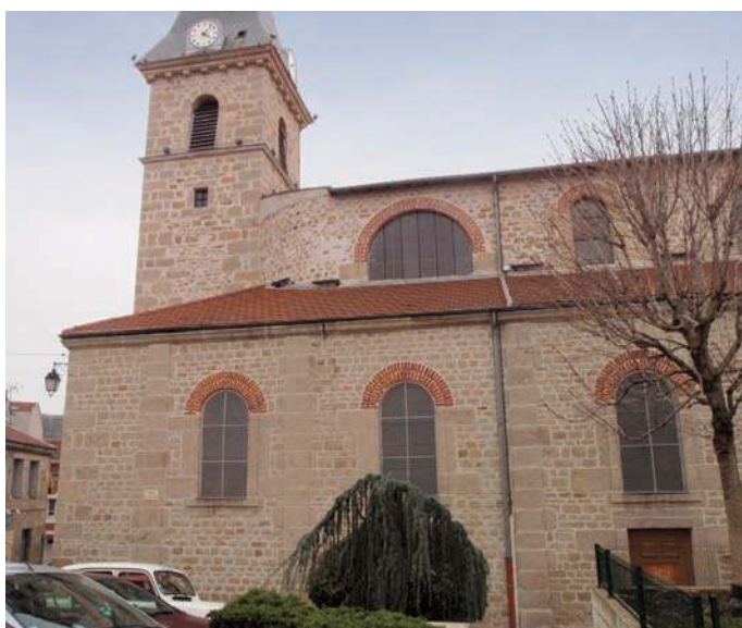
Fig. 188 - Vue de l'église actuelle.

devant l'église. Une vaste place subsiste encore au nord de celle-ci ; mentionnée en 1376 (la platea ), elle est aussi représentée sur le dessin de l'Armorial. Si le tracé des enceintes est clairement lisible dans le parcellaire, signe que ce dernier n'a connu que des remaniements limités, on ne peut que constater la pauvreté du bâti civil en vestiges médiévaux ou même modernes. Il est vrai que l'ensemble a été très largement enduit au ciment... Seules deux maisons situées extra muros sont à remarquer. La première est à l'ouest de l'enceinte du vintain. Il s'agit d'une imposante construction de pierre dont la façade est marquée par la présence d'un grand porche voûté en arc brisé et de plusieurs fenêtres à croisées au premier niveau. À l'opposé, à l'est, une maison à pans de bois subsiste encore (fig. 186), conservant les traces de fenêtres à croisées sur sa façade arrière. Néanmoins, ces deux vestiges isolés ne permettent assurément pas de parler de véritables faubourgs.