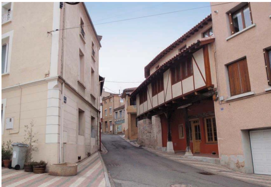
Fig. 186 - Maison à pans de bois, rue Centrale.