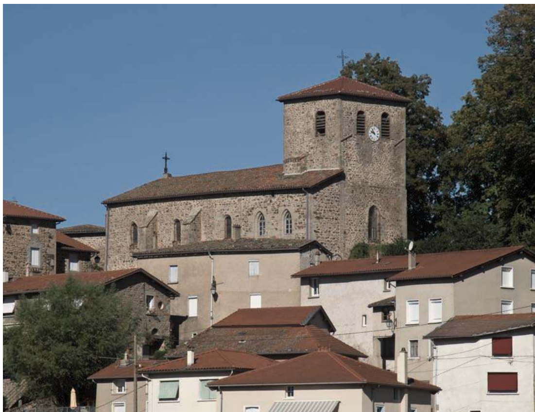
Fig. 173 - Église Saint-Jean de Fontanès.