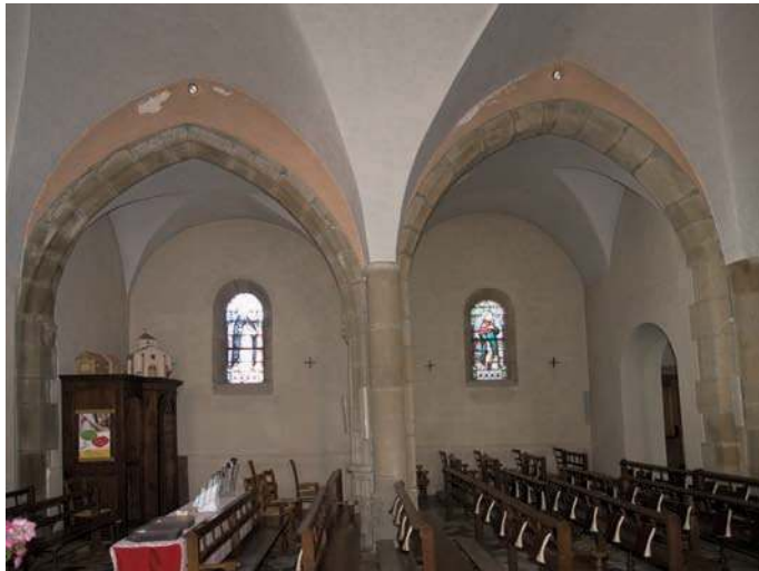
Fig. 174 - Arcatures du XV e siècle dans l'église.