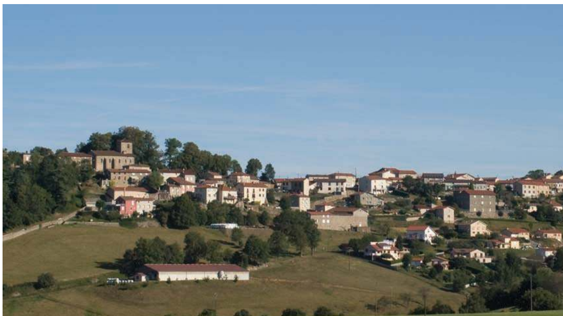
Fig. 172 - Vue d'ensemble du site. Immédiatement au-delà de l'église se dresse le château moderne de Fontanès.

cens et rentes dans les mandements de Saint-Galmier, Fontanès et La Tour en Jarez (Titres de la maison ducale de Bourbon, n° 3800) 2 . L'Hôtel-Dieu de Montbrison possède lui aussi des cens à percevoir dans le mandement de Fontanès, ainsi que nous le rappelle un rôle des tenanciers de 1393 (Titres de la maison ducale de Bourbon, n° 3940). Les mentions de l'église de Fontanès sont plus rares que celles du château. Le pouillé lyonnais de 1225 nous apprend que l' ecclesia de Fontaneto est placée sous le patronage de l'Église métropolitaine de Lyon (Chartes du Forez, n° 901). Par la suite, au début du XIV e siècle, on apprend que cette dernière est placée sous le vocable de Saint-Jean et Saint-Paul (Testaments Foréziens, n° 44). Bien que qualifiée d' ecclesia , et non de capella , l'église de Fontanès n'est qu'une dépendance de celle de Grammond, ainsi que le rappelle le testament de noble Fauvel de Saint-Priest, chevalier et coseigneur de Fontanès (Dufour, 1946, p. 349). Ce lien de sujétion laisse donc penser que l'église de Fontanès, d'origine castrale, a été édifiée dans le ressort de la paroisse de Grammond et qu'elle n'a gagné ses droits paroissiaux que peu à peu, sans parvenir à recouvrer une totale indépendance.