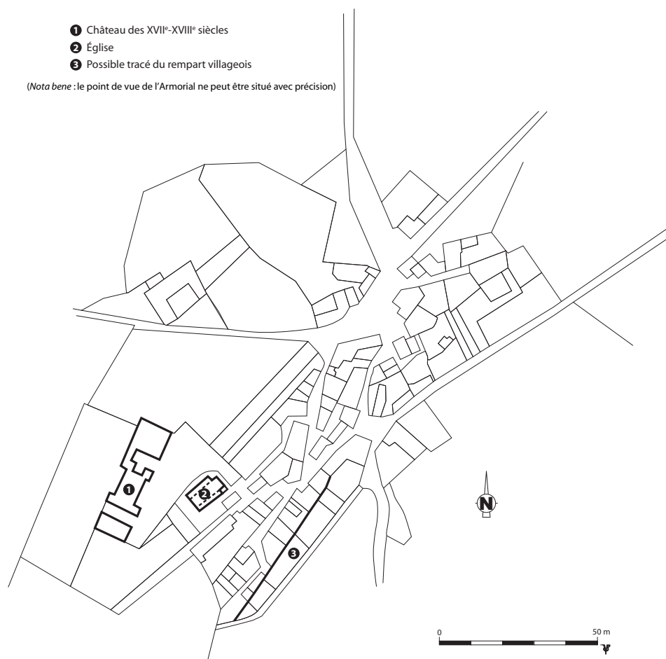
Fig. 171 - Hypothèse de restitution du site (reportée sur le plan cadastral du XIX e siècle) d'après le parcellaire, les vestiges archéologiques et les informations de l'Armorial de Guillaume Revel.