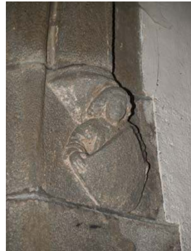
Fig. 175 - Détail sculpté dans la nef : un personnage tenant un écu (XV e siècle).

Fontanès est un très bon exemple de coseigneurie, tel qu'il s'en rencontre de nombreux cas dans un large Midi (Laffont, 2000). Ici, trois lignages apparentés se partagent le fief à parts inégales, imposant au comte de Forez, leur seigneur supérieur commun, de racheter peu à peu, au gré des opportunités, la seigneurie afin de l'unifier et d'en tenir la seigneurie utile. Par ailleurs, le site de Fontanès est un castrum très classique, agglomérant le château initial et un habitat paysan, ainsi qu'une chapelle devenant église paroissiale. La représentation de l'Armorial est pourtant particulièrement difficile à comprendre. Elle présente un site qui correspond typologiquement à Fontanès, mais les grandes divergences constatées permettent de douter que le site représenté soit bien celui qui nous occupe, même si l'état des vestiges conservés ne permet nullement d'être affirmatif.