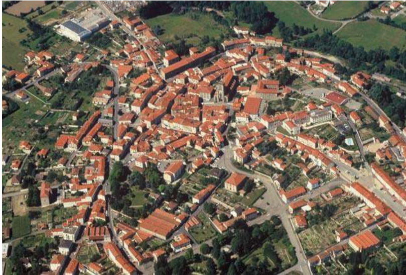
Fig. 108 - Vue aérienne du site dans les années 1990.