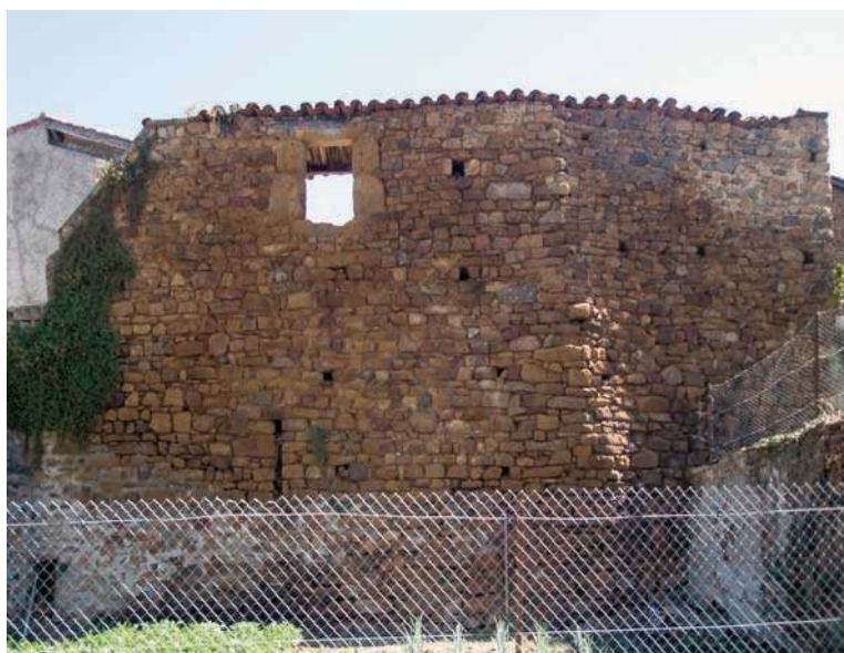
Fig. 94 - Pan de courtine à l'ouest entre la « porte du Gort » et la « tour des Oeufs ». Une ouverture de tir est encore en place à la base du mur.