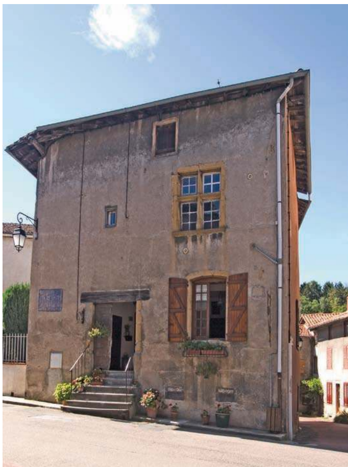
Fig. 98 - Ce bâtiment avec une fenêtre à meneau et traverse, dans la rue centrale de Néronde, pourrait être un des derniers vestiges du château.

démarcation entre les deux pôles, castral et villageois, est nette et réelle et pourrait indiquer l'emplacement de la chemise du château. Notons enfin que le secteur de l'ancien château, même s'il est en partie occupé par la mairie, montre encore à l'ouest d'imposantes maisons au moins d'époque moderne, l'une d'elles présentant même une fenêtre à meneau et traverse (fig. 97, 98). Il est tout à fait possible que ces constructions aient remplacé totalement ou partiellement des bâtiments ayant appartenu à l'ensemble castral ; un pan de courtine de l'enceinte du château pourrait même encore subsister. Une étude plus fine de cet espace en archéologie du bâti serait toutefois nécessaire pour aller plus loin.