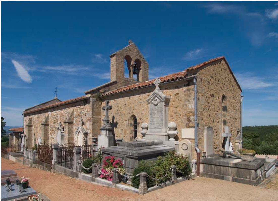
Fig. 92 - La chapelle Notre-Dame.

cette hypothèse (Chartes du Forez, n° 595). Étienne Fournial pense cette possible charte de franchises, contemporaine de celle de Crozet, en 1236, en notant la présence de Guy IV à Néronde en 1234 (Fournial, 196, p. 95). Cela en ferait une des villes comtales affranchies les plus précocement. Le village qui se développe au nord du château s'entoure très tôt d'un système de défense puisqu'une palissade de bois (dont l'actuelle « place du Palu » garde le souvenir) est attestée dès 1236 2 . Elle sera remplacée au XIV e siècle par une enceinte de pierre.