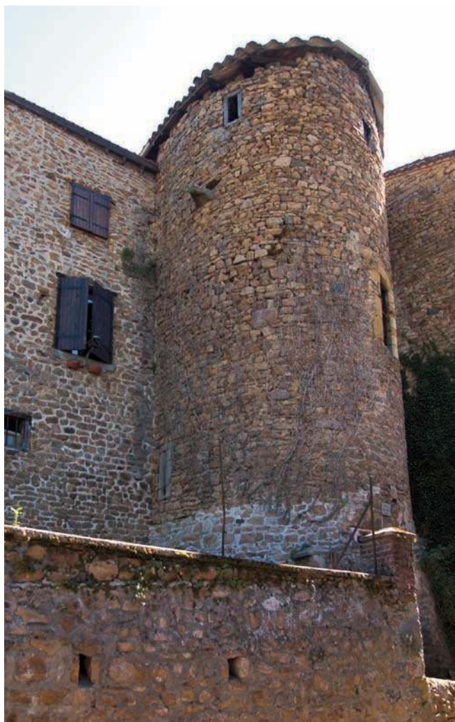
Fig. 95 - Une des tours de l'enceinte du castrum au sud-ouest : la tour dite « tour des Oeufs ».