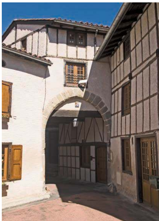
Fig. 96 - Poterne sud, face extérieure.