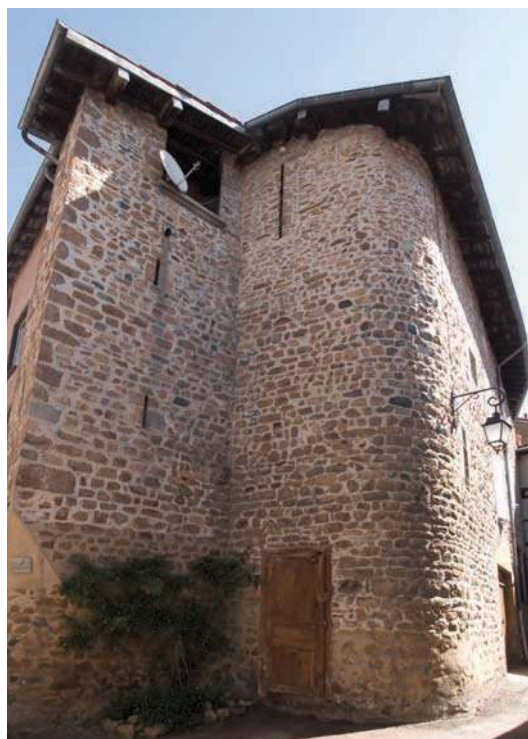
Fig. 97 - Vestiges à l'angle ouest de l'enceinte du château ?

bâtiment. Est-ce là l'hôpital Saint-André ? L'ensemble de l'habitat intra muros semble structuré autour d'une rue et d'une place centrale. Cette dernière se situe au pied de l'église, au milieu du village ; les principales rues venant des deux portes ou du château s'y rejoignent. La démarcation nette entre le réseau de bâti civil très dense et l'espace castral est remarquable.