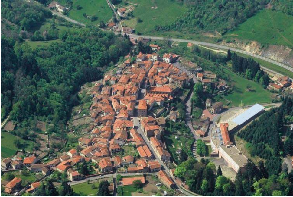
Fig. 90 – Vue aérienne du site dans les années 1990.