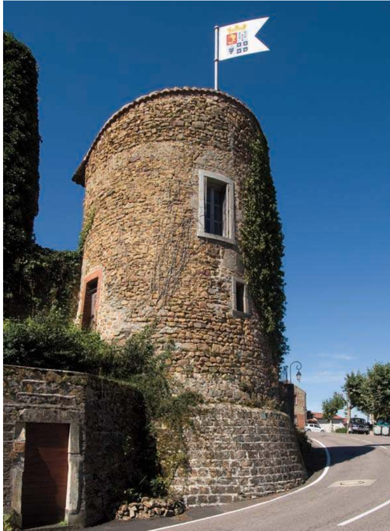
Fig. 93 - Une des tours de l'enceinte du castrum au nord-est : la tour dite « tour Coton ».