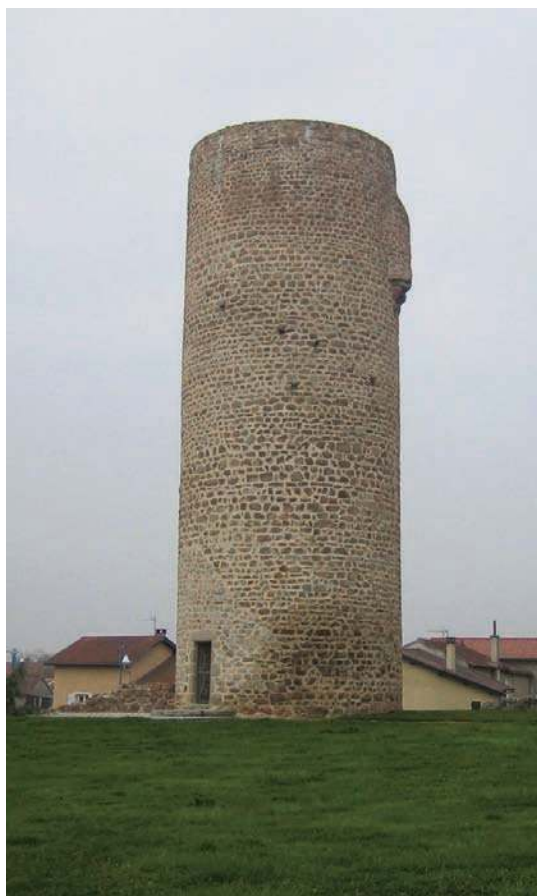
Fig. 85 - La tour maîtresse circulaire.