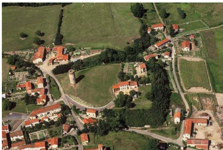
Fig. 83 - Vue aérienne du site dans les années 1990.