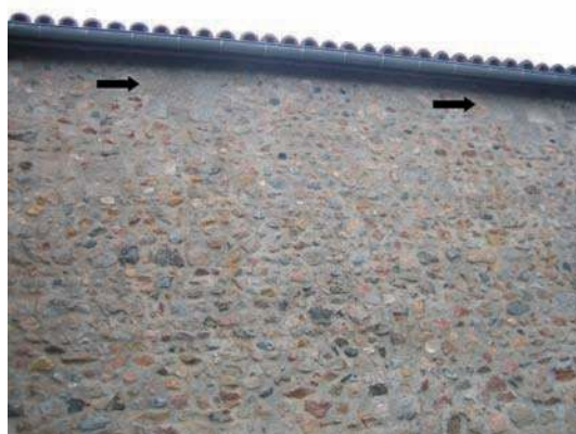
Fig. 88 - Vue des baies romanes bouchées de l'église.