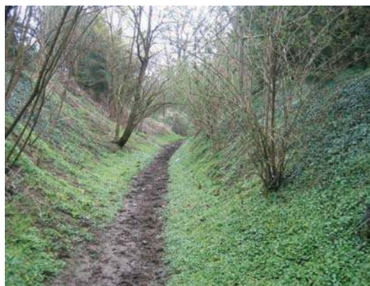
Fig. 86 - Vestiges des fossés de la plate-forme castrale.

celle du dessin de Feurs les deux uniques représentations figurées animant les vignettes foréziennes : ce sont deux pêcheurs jetant l'épervier sur des barques à fond plat rigoureusement identiques. La berge de la rivière forme une gravière aisément identifiable cernée par un couvert végétal assez dense réparti sur un terrain plat. Ce décor soigné s'étale jusqu'à la base des murs de l'enceinte castrale, à l'est de la porte d'entrée du castrum .