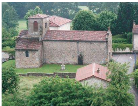
Fig. 87 - Vue d'ensemble de l'église Saint-Martin.